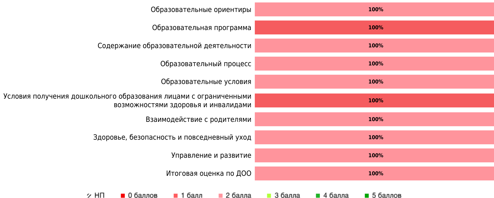
Доли ДОО с разными баллами у педагогов